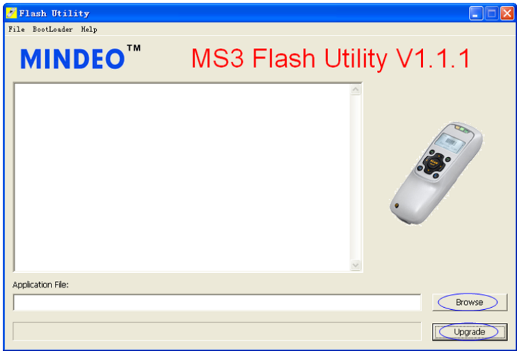
图 2 升级软件用户界面